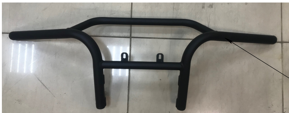
Бампер в сборе