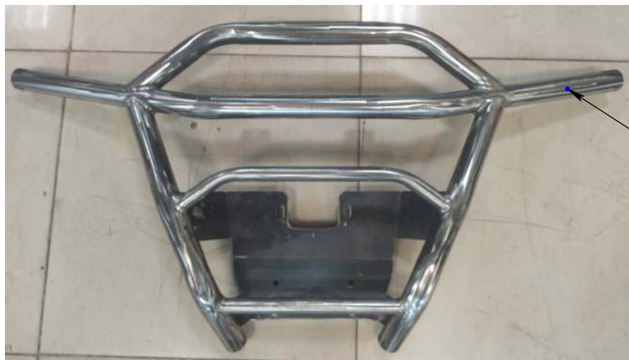
Бампер в сборе (1 шт.)