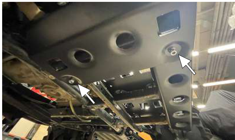
Наживить болт крепления боковой и передней панелей. Наживить болт крепления основания и передней панели.