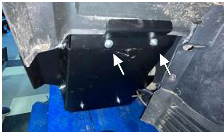
Установить и затянуть крепеж прижимов к передней панели и задней панели.