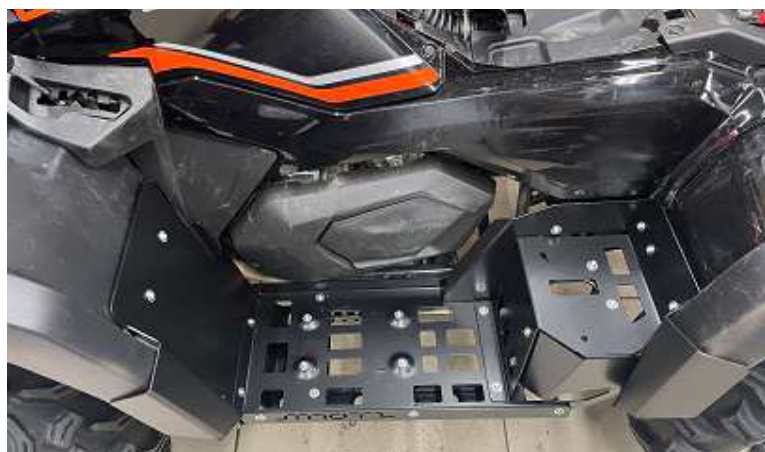
Закрепить основание. Закрепить боковую панель. Закрепить штатные пластиковые элементы.