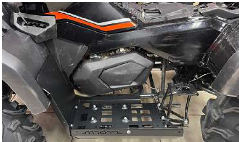
Установить и наживить боковую алюминиевую панель к алюминиевому основанию.