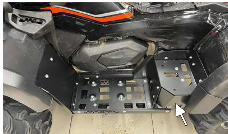
Установить и закрепить сборку панелей на стальном основании. Установить боковую панель опоры ног пассажира. Затянуть крепеж.