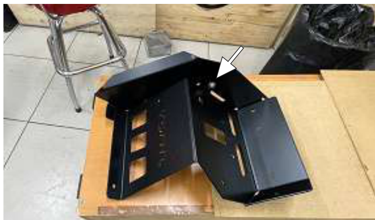
Собрать панели подножки пассажира и бокового элемента как на фото. Наживить крепеж.