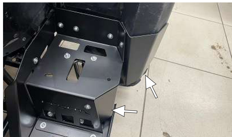
Установить, отрегулировать расширители арок спереди и сзади. Затянуть крепеж.