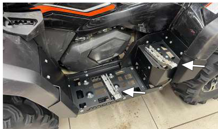
Установить, отрегулировать алюминиевые подножки под ноги. Собрать по-анalogии другую сторону.